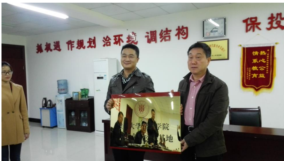
校政共建创新工作站授牌仪式