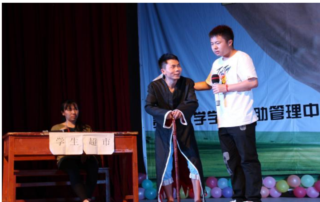
(管院参赛选手正在演绎自己的手绘诚信作品)