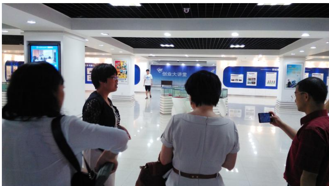
浙江经贸职业技术学院创富中心创新工场