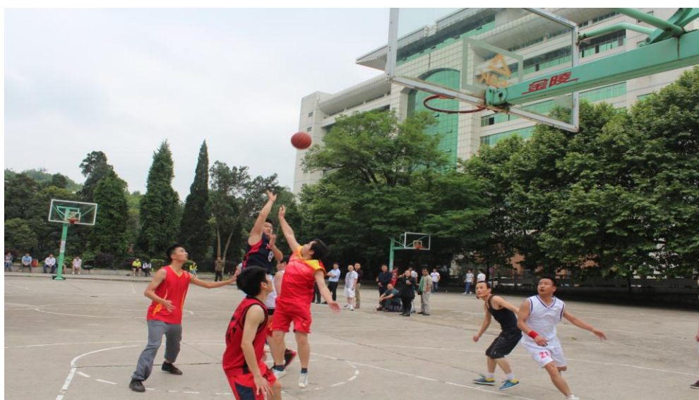
图 1-1 1402 与 1302 班比赛

第一名：MBA1401 班 第二名：MBA1402 班 第三名：MBA1404 班