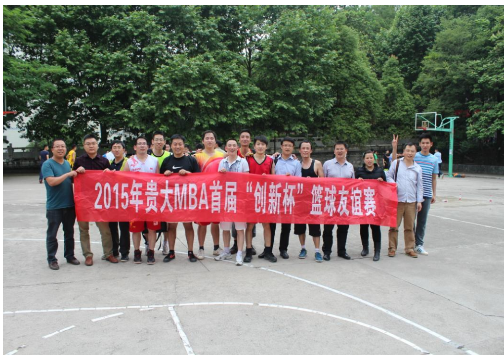
图 1-3 1302 班球队合影