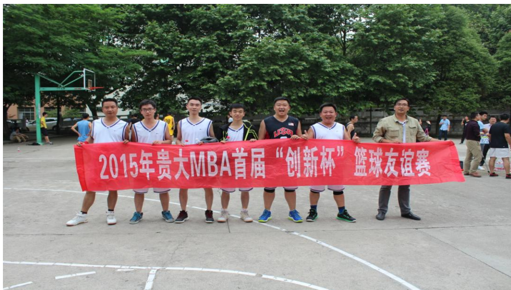
图 1-4 1402 班球队合影