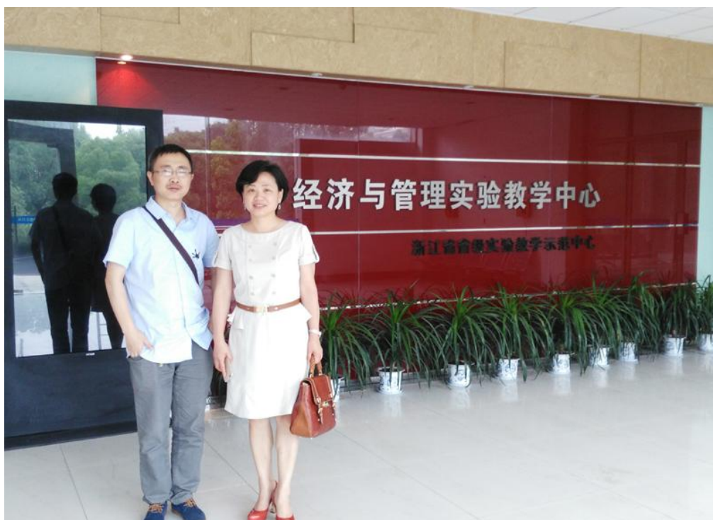
浙江财经学院浙江省省级实验教学示范中心