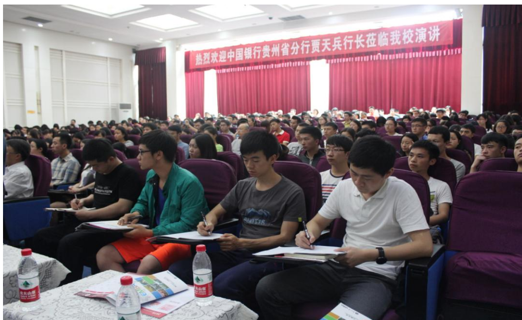
图 1-5 贵大 MBA 同学认真学习记录报告