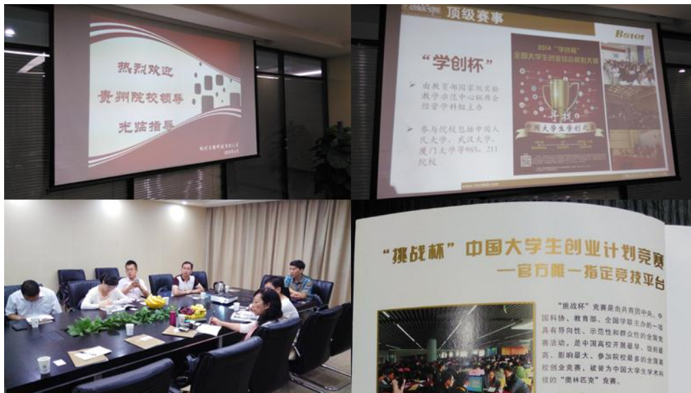
赛事主要技术合作方杭州贝腾科技有限公司