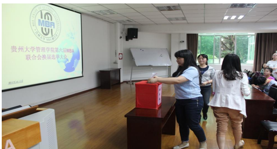
图 1-4 MBA 学生代表进行现场投票