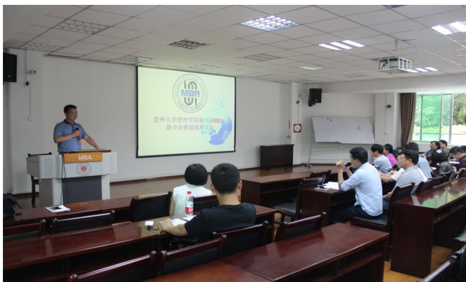
图 1-3 参选学生竞选演讲中回答选举代表现场提问