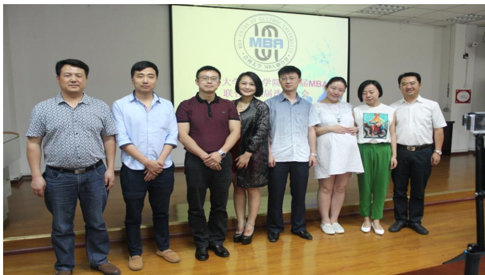
图 1-5 贵大第五届 MBA 联合会的成员在选举会场合影