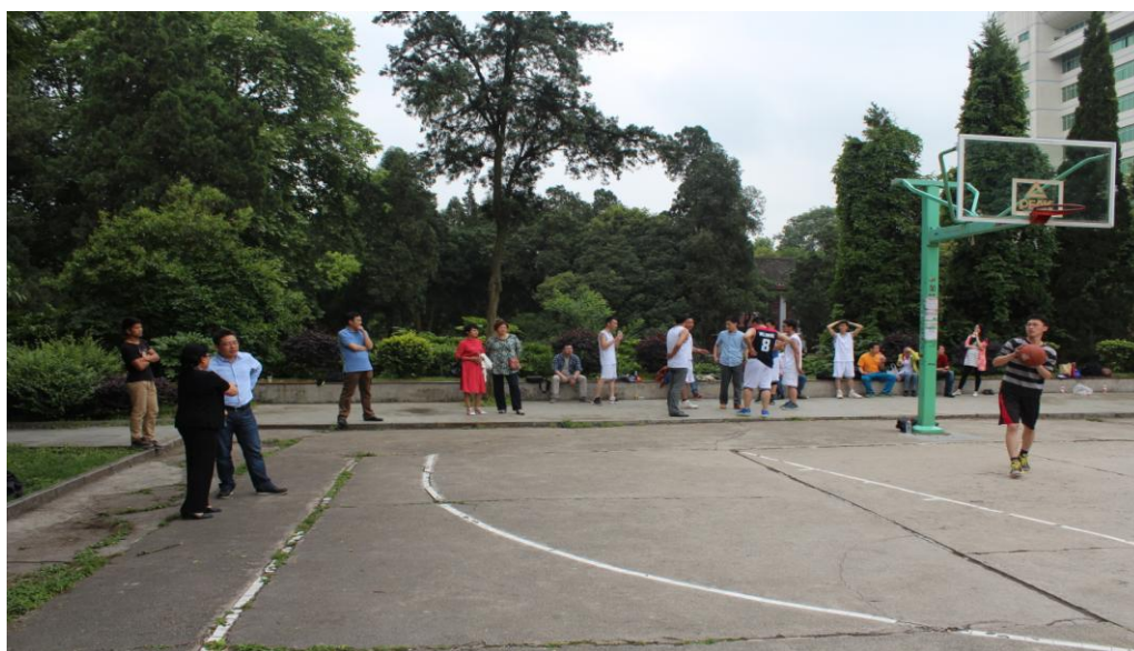
图 1-2 老师和同学们观看篮球比赛