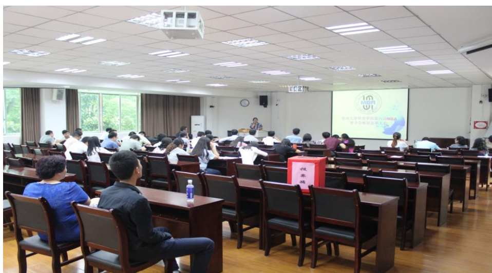
图 1-1 第六届 MBA 联合会换届选举大会会场

1) 以上成员的任职根据其竞选意愿、贵州大学 MBA 联合会章程、竞选最后的得票数等综合而确定；2) 根据贵州大学 MBA 联合会章程规定，MBA 联合会顾问委员会，聘请往届 MBA 联合会成员组成。第六届 MBA 联合会顾问委员为：龙刚、雷雨、赵宇（均为第五届 MBA 联合会主席团成员）；秦平及任韵加入第六届 MBA 联合会（二位同学为 MBA2013 级学生、第五届 MBA 联合会成员），能更好地延续和开展 MBA 联合会工作；3) 各部部长副职尽量从 2015 级的学生里产生，以便 2015 级的学生积极参与各项活动，熟悉相关流程，为下一届的换届提前做好充分准备。