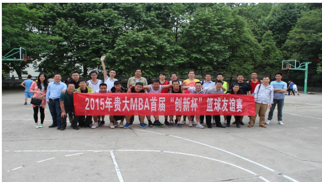
图 1-5 篮球比赛圆满成功